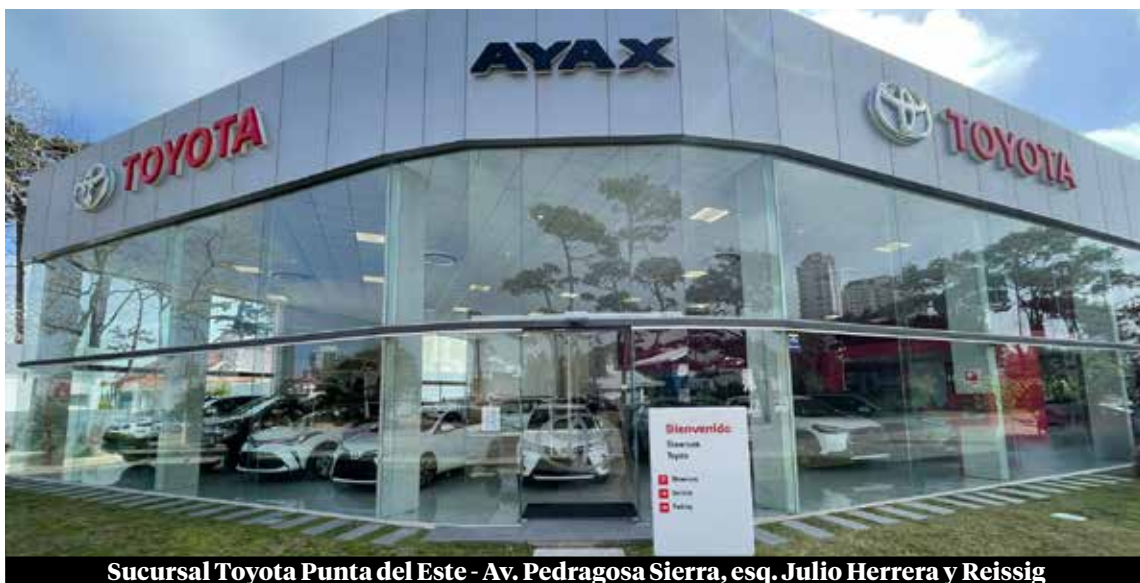
Sucursal Toyota Punta del Este - Av. Pedragosa Sierra, esq. Julio Herrera y Reissig

Ayax proyecta un crecimiento firme en participación de mercado con foco en la expansión del portafolio híbrido, la mejora continua del servicio al cliente y la incorporación de herramientas digitales para la experiencia de compra