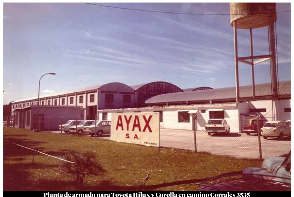
Planta de armado para Toyota Hilux y Corolla en camino Corrales 3535

A lo largo de su historia, Ayax ha atravesado cambios econó-