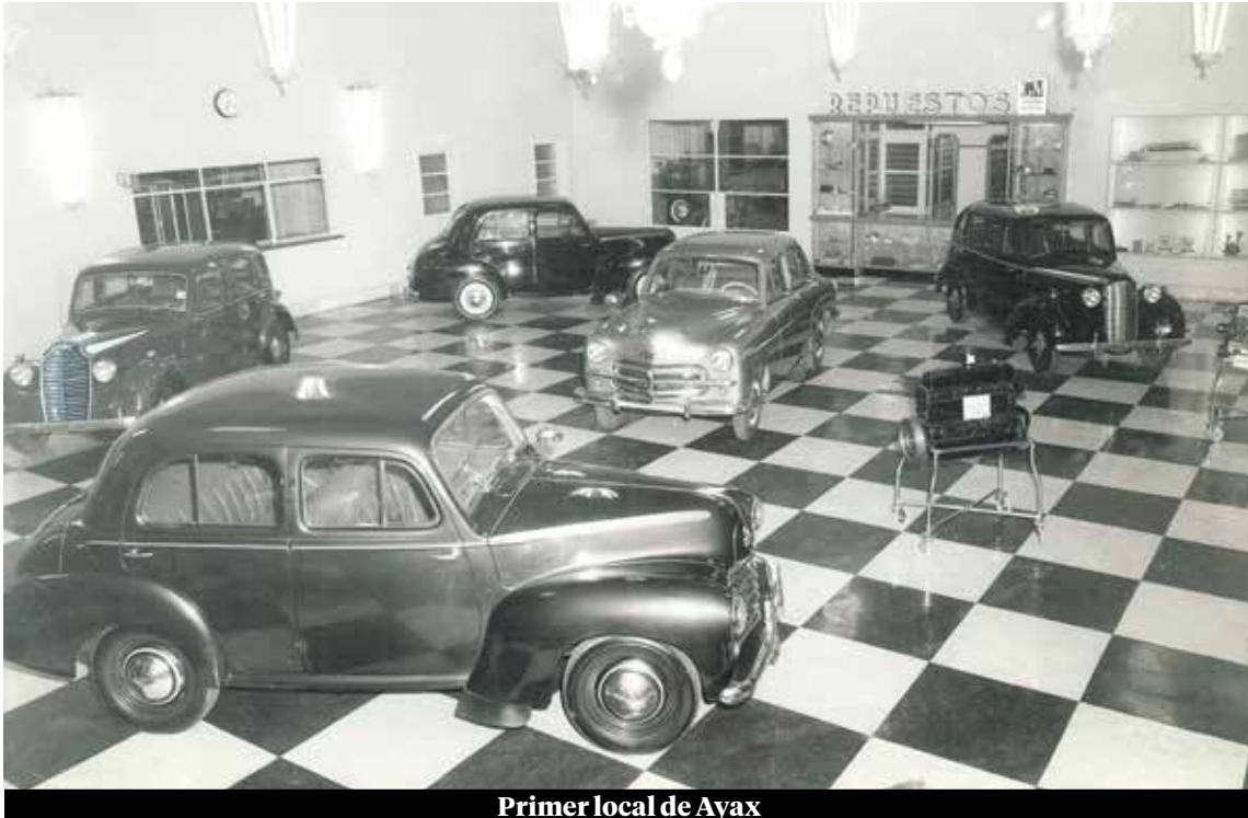
Primer local de Ayax