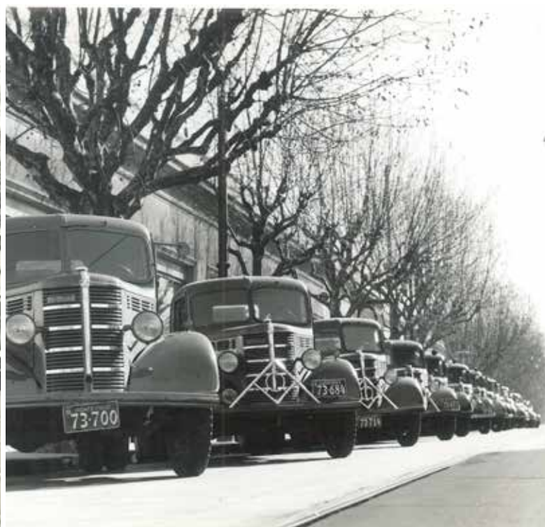
1945: Nace Ayax en avenida Rondeau 1921

El 1° de enero de 1945, mientras el mundo aún vivía los últimos combates de la Segunda Guerra Mundial, nacía en Avenida Rondeau 1921 una empresa llamada Deal Smith, dedicada inicialmente a la importación de productos de laboratorio, máquinas telares y papeles para imprenta. No tardó en adoptar un nombre que se volvería icónico: Ayax, en homenaje al crucero británico HMS Ajax, protagonista de la Batalla del Río de la Plata frente al acorazado alemán Graf Spee.