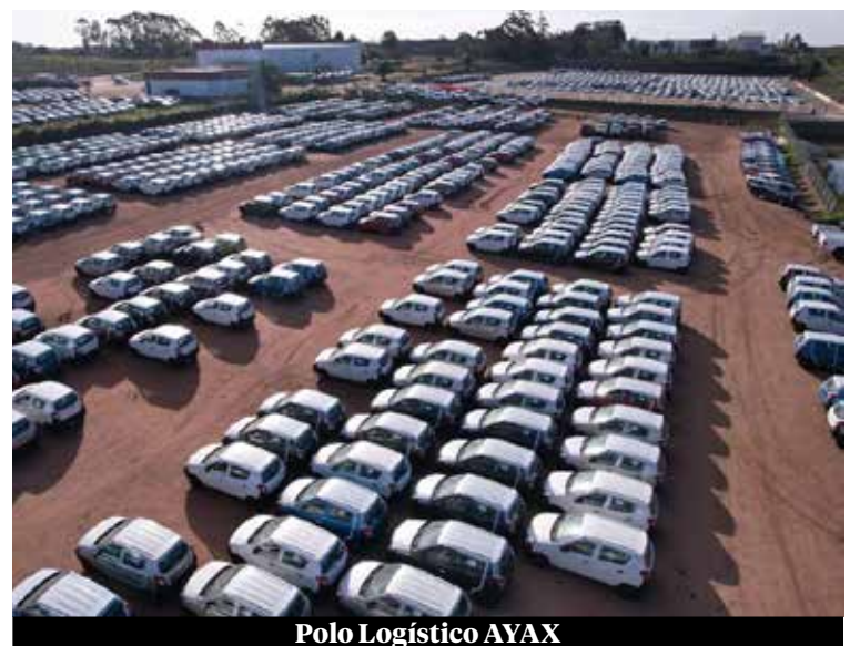
Polo Logístico AYAX

T ras ocho décadas de historia, Ayax no solo mira hacia atrás con orgullo, sino que proyecta el futuro con objetivos comerciales ambiciosos para sus dos marcas representadas: Toyota y Suzuki. Con un enfoque centrado en el cliente, un portafolio de productos sólido y una red de posventa que cubre todo el país, la compañía trabaja para fortalecer su presencia en los segmentos clave del mercado automotor uruguayo.