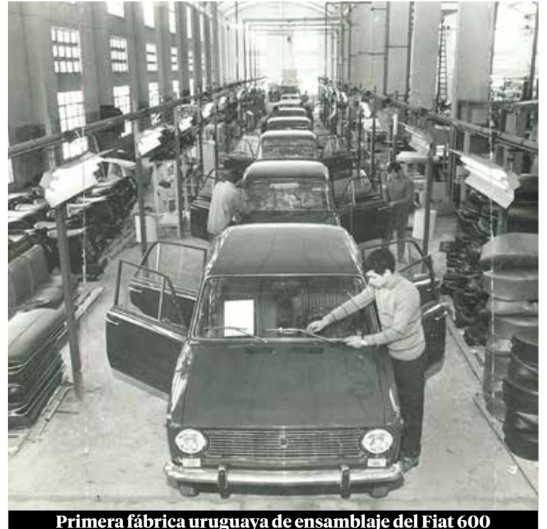
Primera fábrica uruguaya de ensamblaje del Fiat 600

cipaba estándares japoneses que se adoptarían más tarde.