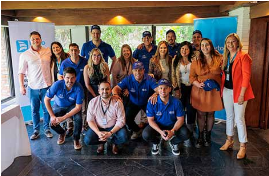
Otra instancia gráfica del evento de premiación