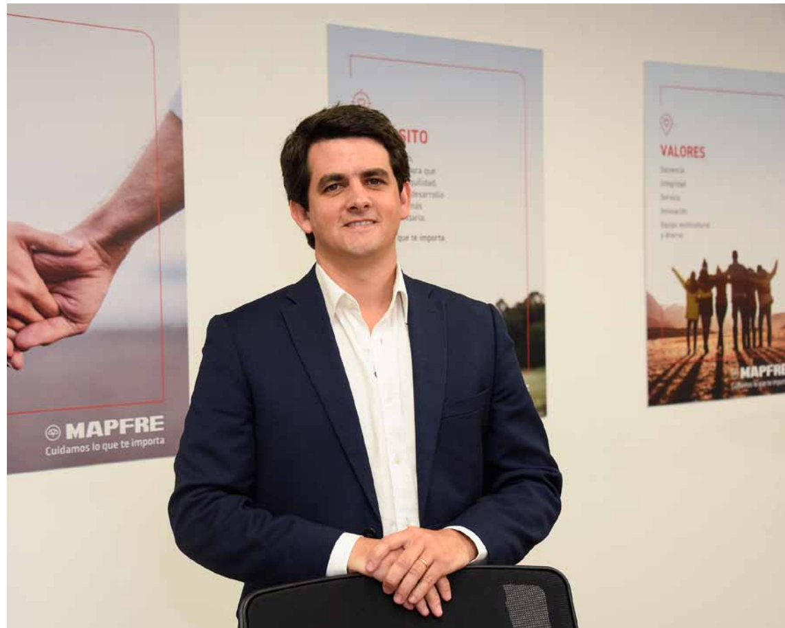
Preve: no debemos perder de vista que somos personas cuidando personas

En todos nuestros productos, buscamos posicionarnos como el mejor servicio en todo momento. La innovación y flexibilidad han sido los principales elementos diferenciadores de nuestra garantía de alquiler. A la hora de contratar, ofrecemos un sistema de contratación rápido, sencillo y completamente