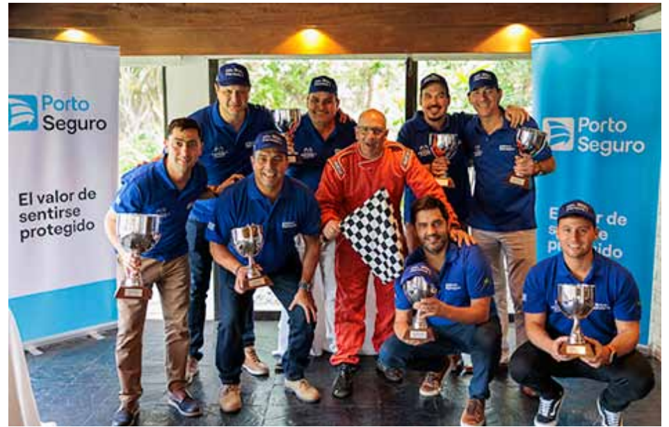
Otro aspecto del acto de premiación