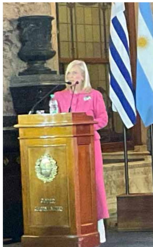
Vicepresidenta de la República, Beatriz Argimón

Como expresé en mi discurso inaugural gracias a esta Cumbre Iberoamericana “tenemos- tuvimos la enorme dicha y oportunidad cuasi única de poder debatir sobre seguros con una mirada humanista. Cuán necesaria es esta mirada en todos los ámbitos de nuestra vida. Porque, no nos