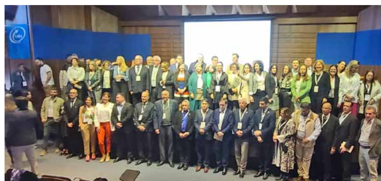
Asistentes a la importante cumbre de seguros

equivocamos, esta no es una necesidad creada por la inteligencia artificial y su escalada. Es un facilismo creer que la tecnología